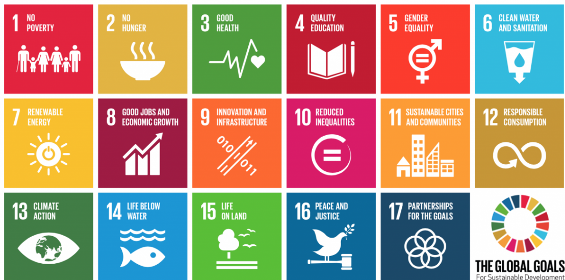
Figuur 1: Overzicht SDG's

Gezondheidszorg, Verminderen gebruik eenmalig plastic en Klimaatverandering. Door deze thema's te adresseren, via doelinvesteringen, engagement, stemmen en het ondersteunen van investor statements , beoogt PMA een bijdrage te leveren aan UN Sustainable Development Goals (SDG's) 3 (gezondheidszorg voor iedereen) en 13 (aanpak klimaatverandering), 14 (leven in water) en 15 (leven op het land).