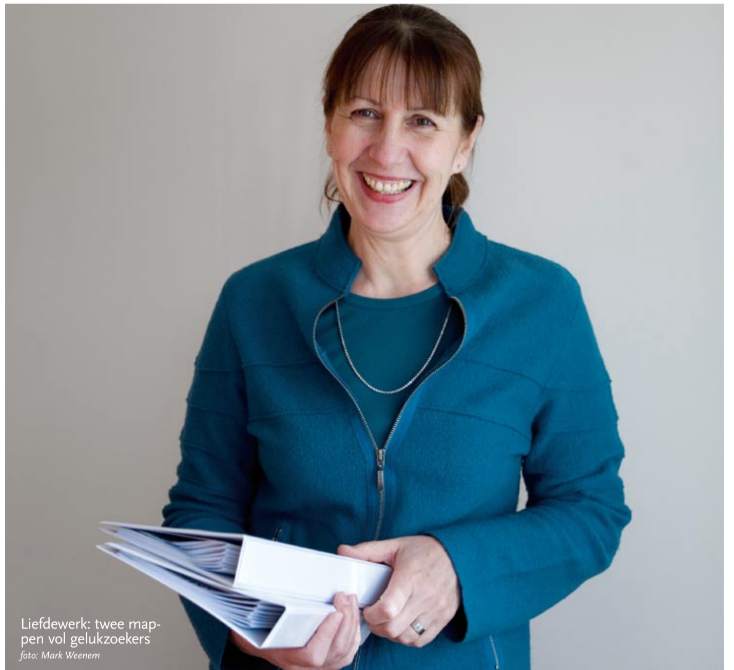
Liefdewerk: twee mappen vol gelukzoekers

Een enkele keer doe ik natuurlijk wel een voorstel. Als ik merk dat mensen maandenlang geen actie ondernemen bijvoorbeeld. Dan bel ik wel eens met een tip. Coachen hoort er ook bij. Aan mannen moet ik soms uitleggen dat ze dringend naar de tandarts moeten, of dat ze voor een afspraak beter een mooi overhemd kunnen aantrekken dan een vies T-shirt. Een stukje begeleiding na de eerste ontmoeting is ook belangrijk. Bij zo'n eerste ontmoeting zijn beide partijen